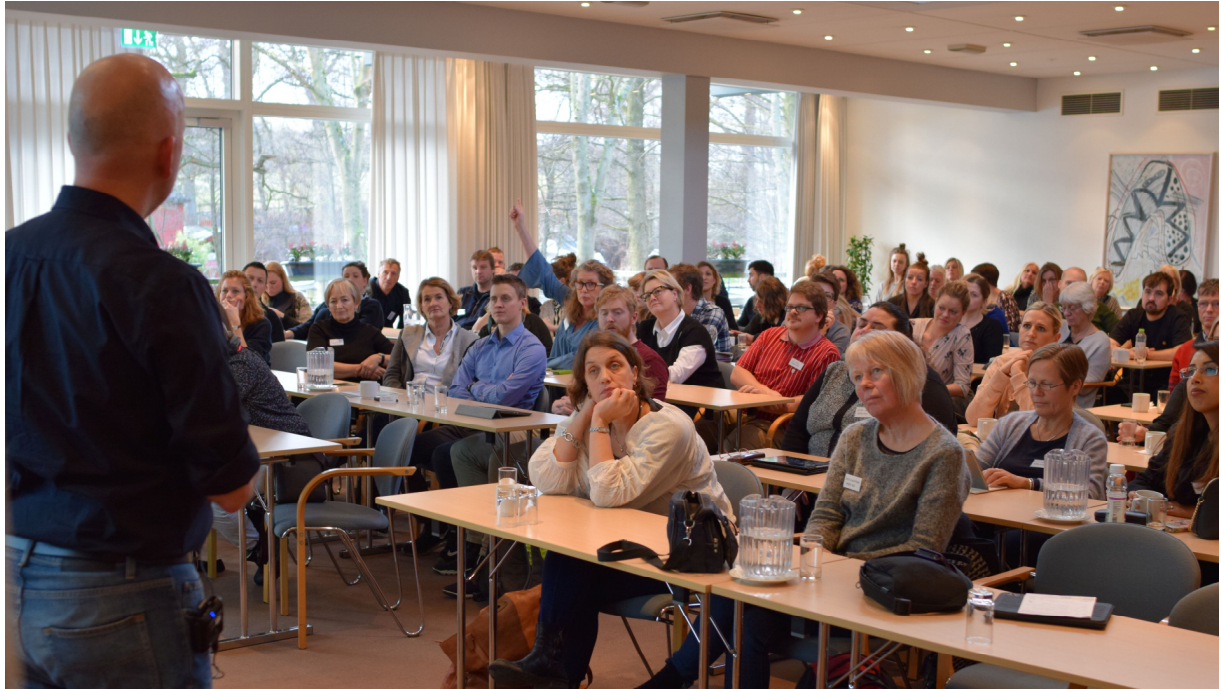
Åbent kursus 2017