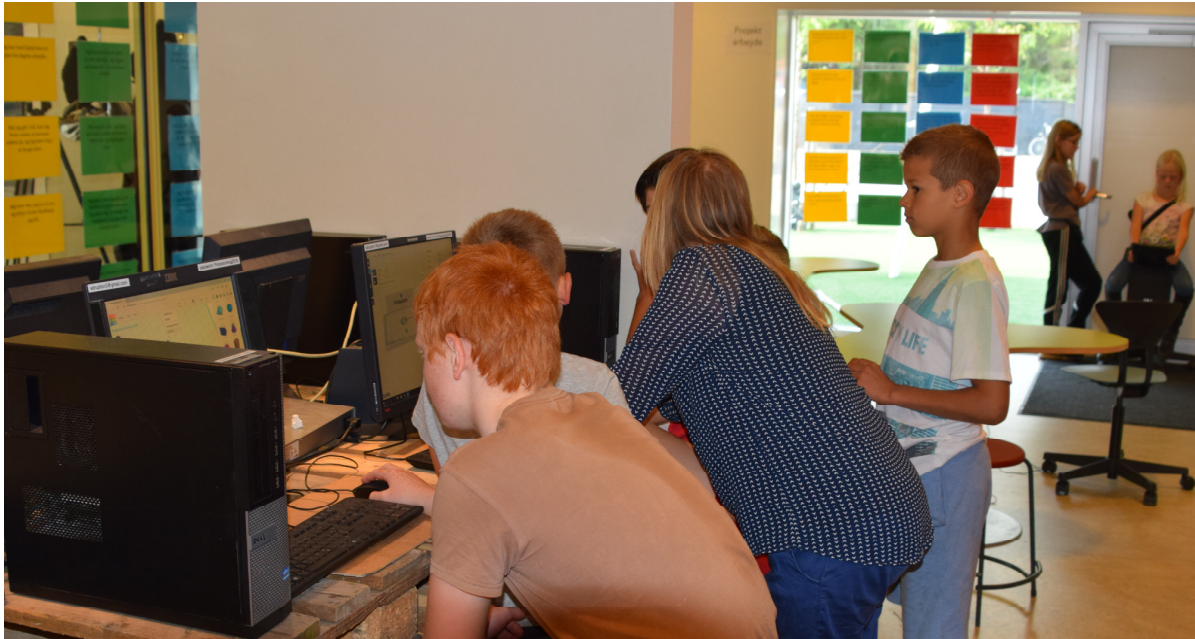
Projektundervisning på Bagsværd Skole

Vi har brug for en ny budgetmodel, hvor den nuværende skoleindividualiserede kamp om eleverne erstattes af en fælles kamp for eleverne. Jeg så gerne en mere tilbundsående diskussion om strukturen i vores nuværende skolevæsen, men er lidt i tvivl, om den politiske magt har modet til at være med.