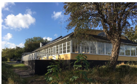
Halleklippen på Bornholm

Det er på sin plads at sige, at koloniområdet har trukket store vekslers i 2016. Efter flere år med dårlig økonomi og mangelfuld styring har bestyrelsen i stadig stigende grad måttet involvere sig i koloniernes drift. Senest lagde vi i forsommeren 2016 op til en omstrukturering, som skulle tilføje kolonierne mere ledelseskraft. På baggrund heraf valgte koloniforretningensfører at fratræde sin stilling. Da vi stod midt i et vade-sted, og da det nye skoleår var lige på trapperne, måtte vi afholde en ekstraordinær generalforsamling, som gav os lov til at køre videre uden forretningsfører.