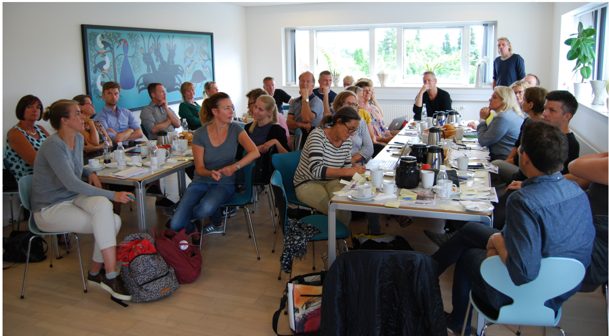
Lærere og ledere til møde om "åben skole" på kredscontoret

ning, som de ønsker. Det kræver en solid bagage, som de bl.a. kan få fra den mangfoldighed, som det omgivende samfund indeholder.