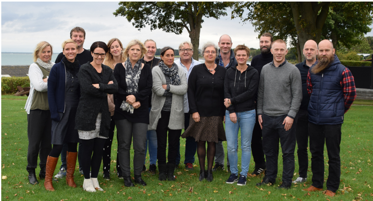
Tillidsrepræsentanter og bestyrelse på TR-kursus i Rødvig 2016