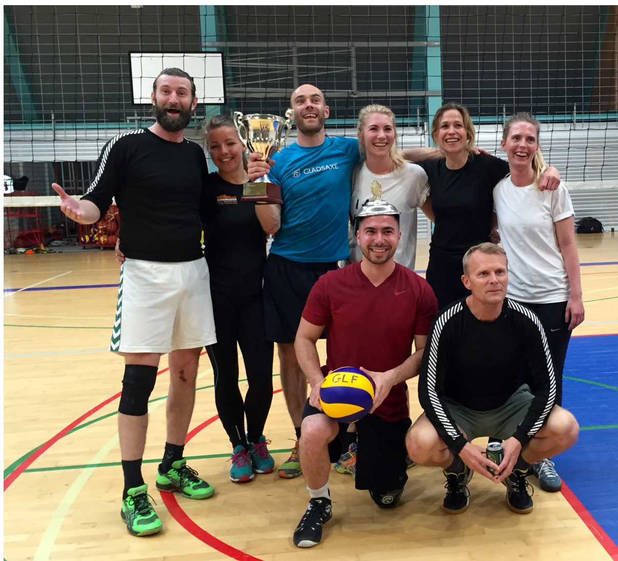
Enghavegård Skole vandt a-rækken til lærerforeningens volley-turneringen 2016

medlemmer i PPR har den bedst mulige fagpolitiske repræsentation, har vi iværksat, at der vælges en tillidsrepræsentant, som fra 1. august 2017 repræsenterer alle vores medlemmer i PPR. Jeg har store forventninger til, at tosproglærerne, konsulenterne, psykologerne og talehørekonsulenterne i et nyt fagpolisk fællesskab kan sikre en stærk varetagelse af både generelle, specifikke og unikke interesser.