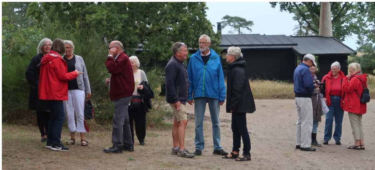
Pensionisttur til Isøre den 13. august

Foreningens 100 års fødselsdag den 20. november fik en velfortjent, central placering i vores arbejde på de indre linjer. En festlig fredagsbar, en velbesøgt reception, en vellykket pensionisttur til Isøre og lækre kagemænd m/k til alle tjenestesteder markerede den runde begivenhed. Tak for fremmøde, gaver, humør og pæne ord. Alt sammen giver det god energi til begyndelsen på de næste 100 år.