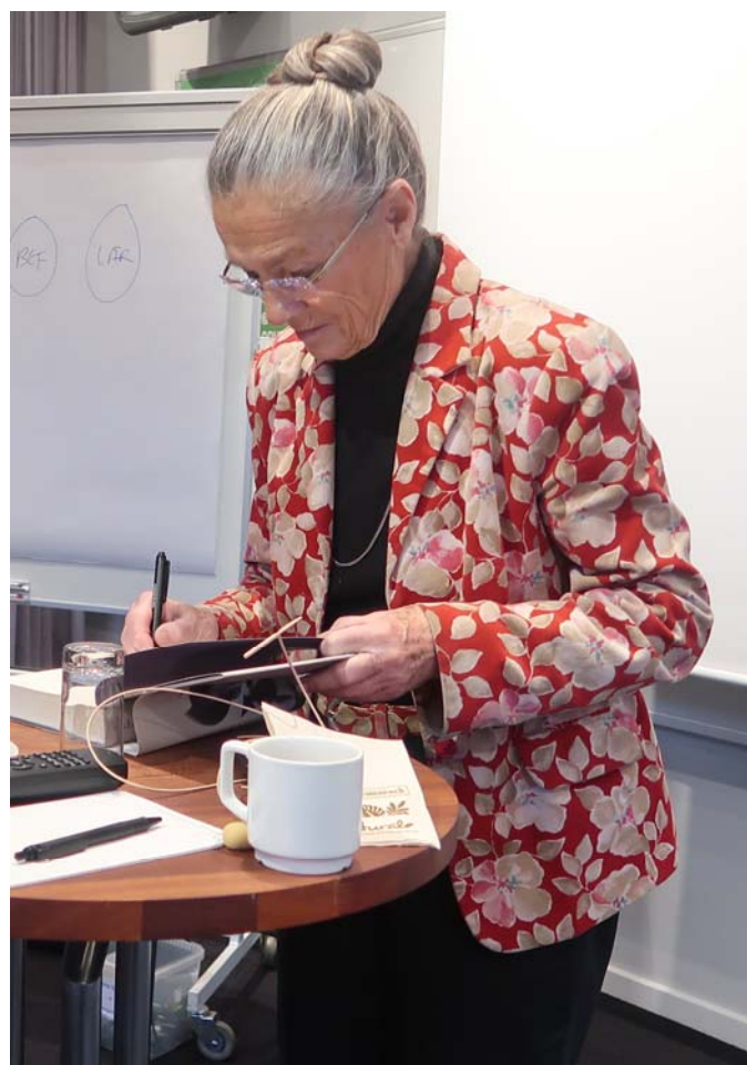
Ritt Bjerregaard fortalte om et langt liv i politik