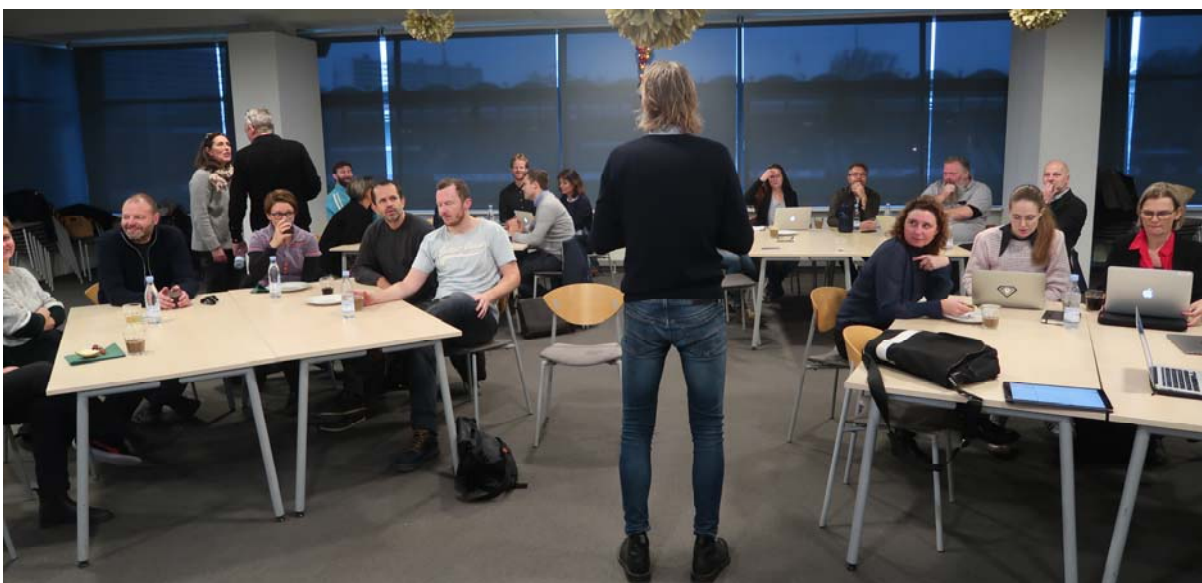
En nyskabelse i dette skoleår er fællesmøder mellem GLF, TR, skoleledere og forvaltning