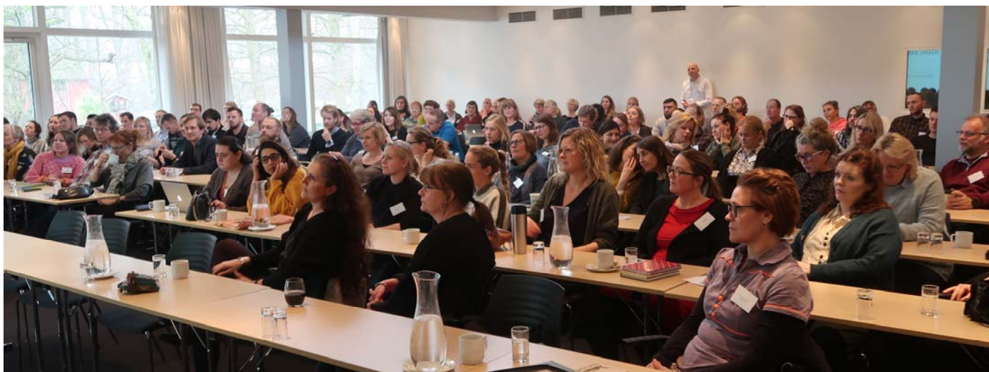
Vi fik mere end 150 tilmeldinger til Åbent Kursus og måtte derfor trække lod om pladserne