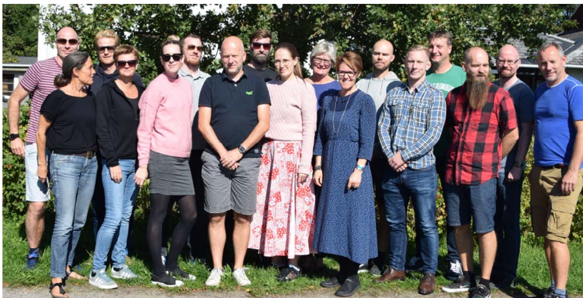
Tillidsrepræsentanter og bestyrelse, september 2018

Vi har sat særligt fokus på ansættelsesudvalg. Her mener vi, at medarbejderne skal være repræsenteret, og det skal ske via en medarbejderrepræsentant. Valgt af medarbejderne, så man sidder der på et klart mandat. Det er faktisk også fast praksis de fleste steder. Vi skal nu bare lige have de sidste med.